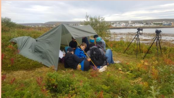
«Fuglepost» på Øyadagen